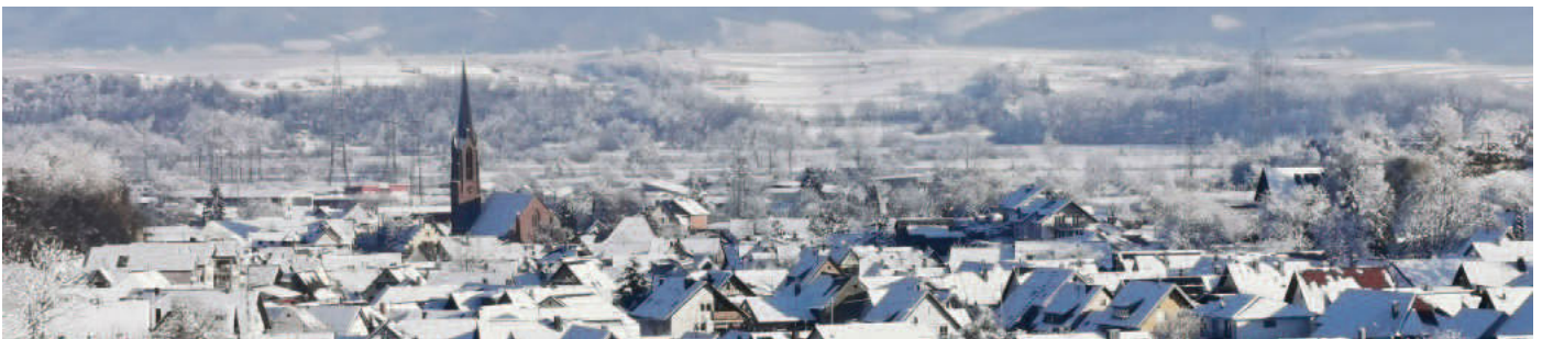
Winterbild: Brigitte Wolf