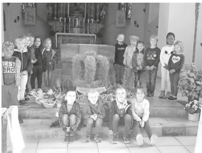
Vorschulkinder von unserem Kindergarten St. Franziskus brachten ihre Erntedank-Körbchen in die Kirche