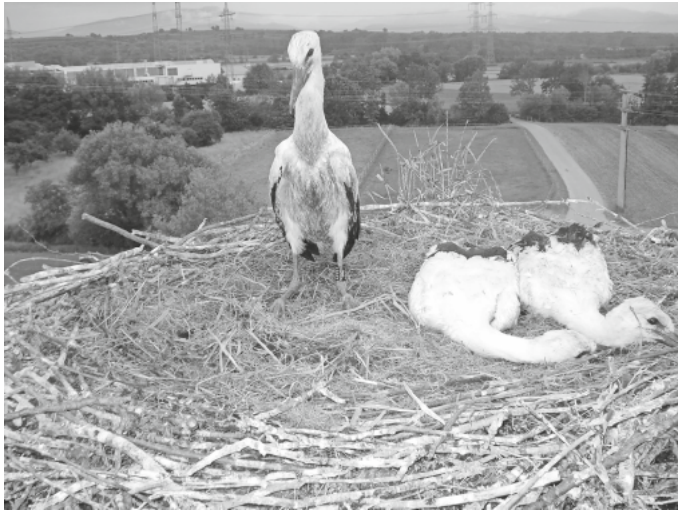
Die erste erfolgreiche Brut bei der Aumühle aus 2015