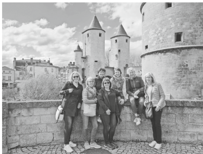
Studienfahrt der Französischgruppe im Frühjahr 2023 nach Metz