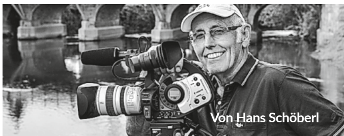
Von Hans Schöberl

Der BLHV bietet vom 9. – 20. Juni eine Reise nach Kanadas Osten an. Das Reiseprogramm beinhaltet landwirtschaftliche Betriebe, Natur und Kultur. Ziele sind unter anderem Toronto, die Niagara Fälle, Montreal und Québec. Reisepreis: 4.095 € pro Person. Bei Interesse bitte melden unter 0761 27133834 oder info@agrardienst-baden.de