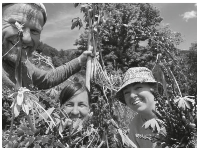
Lupinen entfernen macht Spaß;