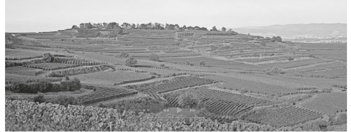
Blick auf Schambachtal und Endhahle

Veranstalter: BUND Regionalverband Südlicher Oberrhein mit dem „Verein für den Erhalt der Kaiserstühler Endhahle und ihrer Umgebung e.V.“