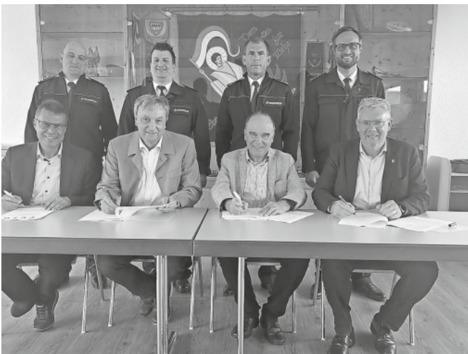
Die Bürgermeister der Gemeinden Bötzingen, Eichstetten, Gottenheim und Umkirch unterzeichneten im Beisein von Vertretern der Feuerwehren im Bötzingen Feuerwehrhaus eine Vereinbarung zur Schaffung eines gemeinsamen Atemschutzpools.