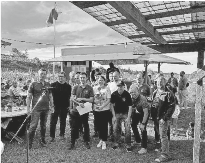
Die Siegermannschaften des Vereinspokalschießens