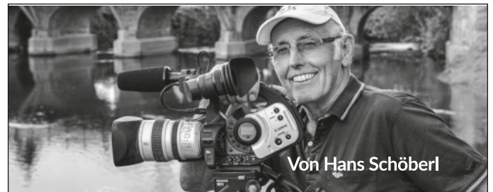
Von Hans Schöberl

Im Rahmen dieser Erfassungen ist es den kartierenden Fachpersonen als Beauftragte der LUBW entsprechend den Vorgaben des § 52 NatSchG grundsätzlich erlaubt, Grundstücke ohne vorherige Anmeldung zu betreten. Die Kartierenden betreten nur offene Landschaft und Wald im Außenbereich. Fest umzäunte Privatgärten werden ohne Zustimmung nicht betreten. Die von der LUBW beauftragten Personen haben eine Bescheinigung erhalten, die sie im Gelände mit sich führen. Die Stichprobenflächen bleiben anonym, um die Aussagekraft des Monitorings zu gewährleisten. Es erfolgt auch keine Zuordnung der Ergebnisse zu Grundstückseigentümerinnen und -eigentümern oder Bewirtschaftenden. Dauerhafte Markierungen werden nicht vorgenommen. Der Zeitpunkt der Erfassung richtet sich nach dem Entwicklungsstand der Arten oder Lebensräume und wird stark von den aktuellen Wetterbedingungen beeinflusst. Eine Begleitung der Erfassungen vor Ort ist leider nicht möglich. Bei Fragen steht Ihnen die LUBW unter folgender E-Mail-Adresse zur Verfügung: post-stelle@lubw.bwl.de